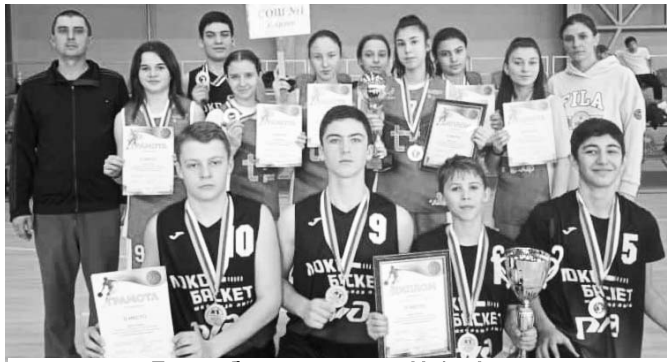
Баскетболисты школы №1 г.Ардона.

— Чем больше наших ребят и девушек будут заниматься спортом для себя, тем здоровее станет новое поколение. А тем, в ком благодаря таким соревнованиям раскроются спортивные таланты,